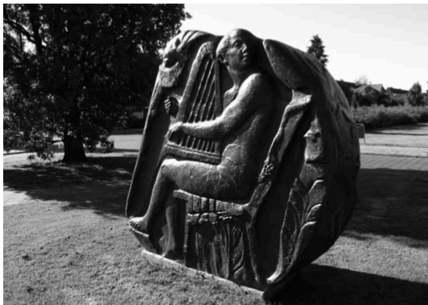
De Muzen, Pan en Orpheus, Kamerlingh Onnesweg (hoek Eemnesserweg), Hilversum. foto Paul Grégoire, 1975.