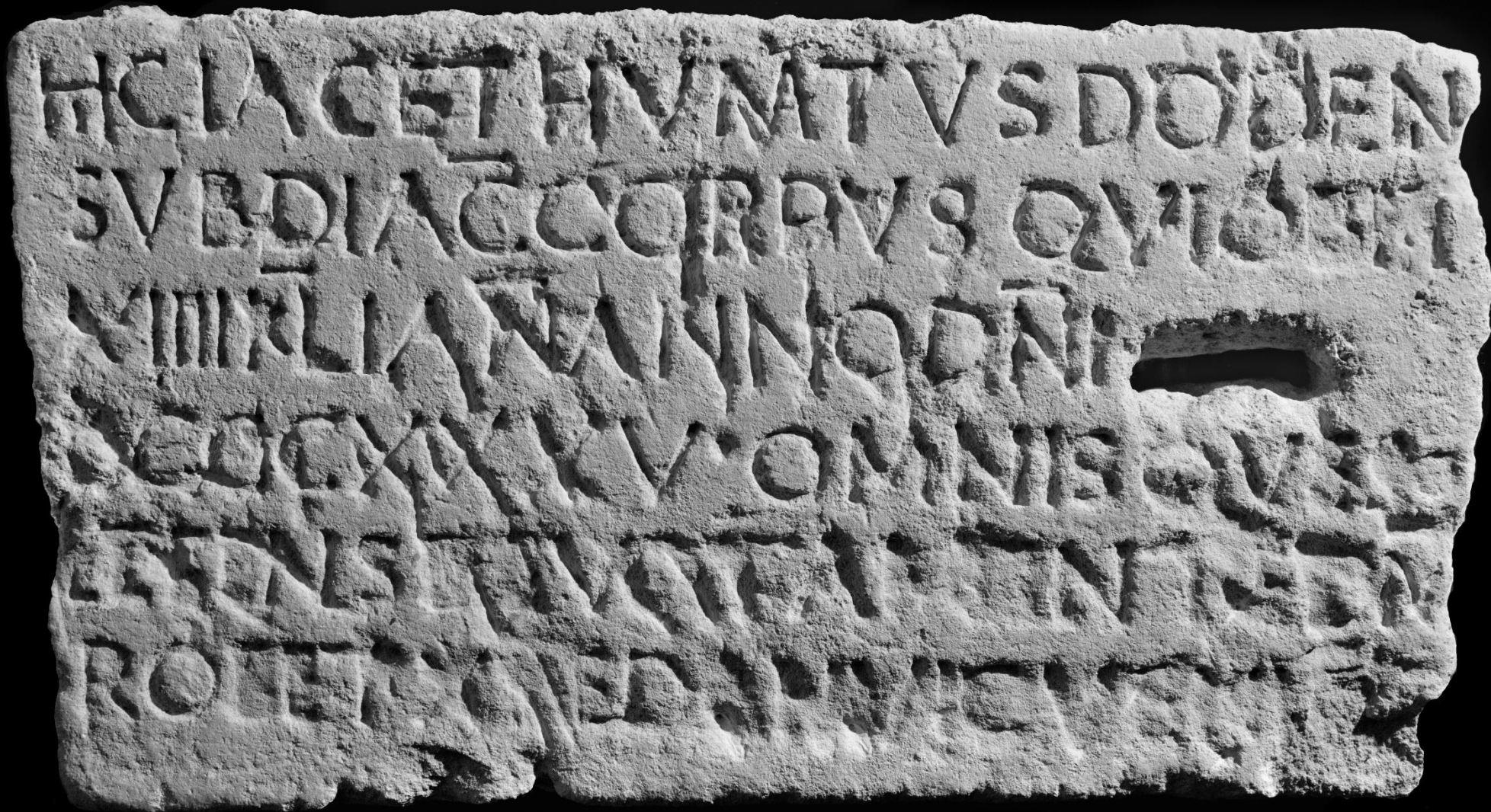
Dodenus, subdiaconus († 834)